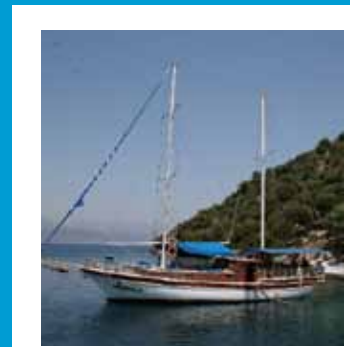
Zeileruise in Turkije